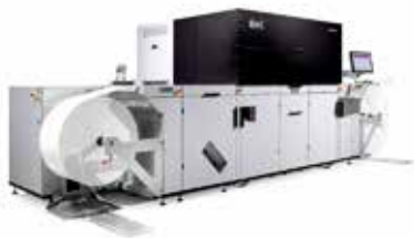
Tau 510 RSCi com Flexo Station

Novidades em equipamentos, automação por meio de softwares e aplicações para diversos usos no segmento de rótulos. Liderando o universo da transformação em impressão digital inkjet para rótulos, a Durst anunciou as novidades que levará para a Labelexpo de Bruxelas, Bélgica, de 11 a 14 de setembro.